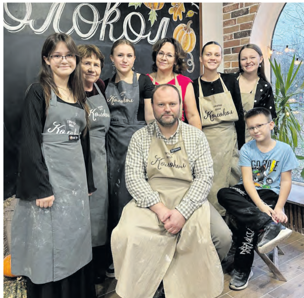
■ Для многодетной семьи любой мастер-класс становится групповым

— Если ребенок хочет с тобой поделиться, то надо задвинуть все дела и обязательно пообщаться, — считает она. — Детям жизненно необходимо быть услышанными.