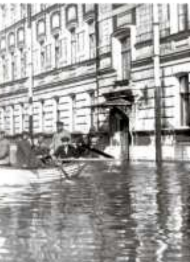
На фото: последствия наводнения 1924 года в Галерной гавани. Тогда невольная вода поднялась на 369 см выше ординара. Более сильным было лишь знаменитое наводнение 1824 года с подъемом воды на 410 см.

затопляемым местом Галерного селения. Именно здесь начались работы по подсыпке Гавани в 1863 году, для защиты ее от наводнения. На проезжей части установили гранитный блок с бронзовой закладной доской о начале работ по возвышению местности Галерного селения с проложением первой мостовой.