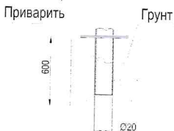
Схема установки закладной для парковой мебели

18.4 Монтаж скамьи производится сваркой к заранее заглубленным в грунт закладным.