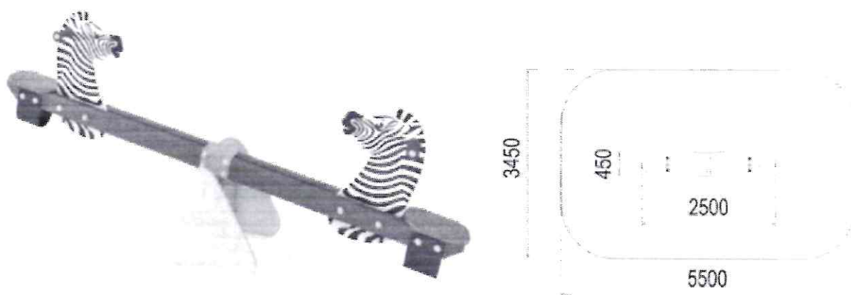
Общий вид детского игрового оборудования.

Производитель оставляет за собой право на внесение изменений в дизайн, комплектацию, а также в технические характеристики изделия в ходе совершенствования своей продукции без дополнительного уведомления об этих изменениях