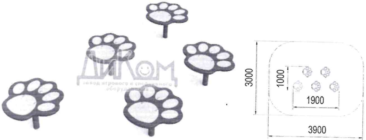
Общий вид детского игрового оборудования.

Производитель оставляет за собой право на внесение изменений в дизайн, комплектацию, а также в технические характеристики изделия в ходе совершенствования своей продукции без дополнительного уведомления об этих изменениях